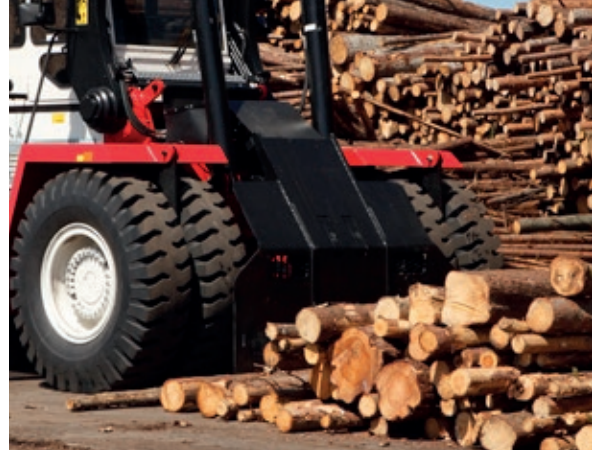
Empurrador de troncos

Como padrão, a Svetruck TMF possui o Svetruck D5 que constitui um sistema de controlo e monitorização completo para fornecer ao operador uma visão geral do estado da máquina.